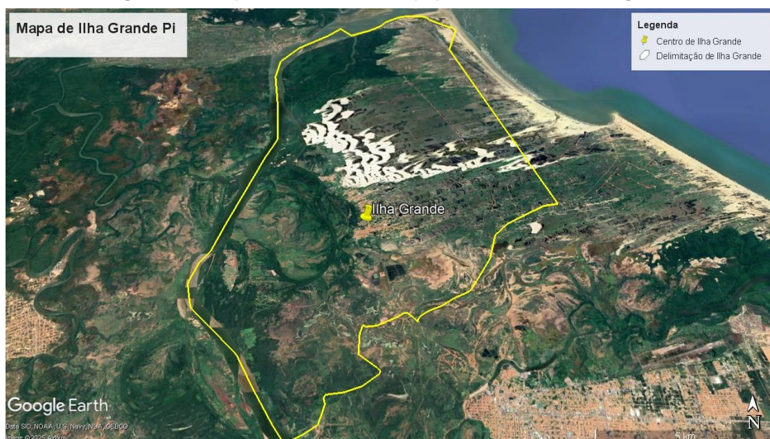
Figura 1 – Mapa de Ilha Grande (PI) elaborado no Google Earth.