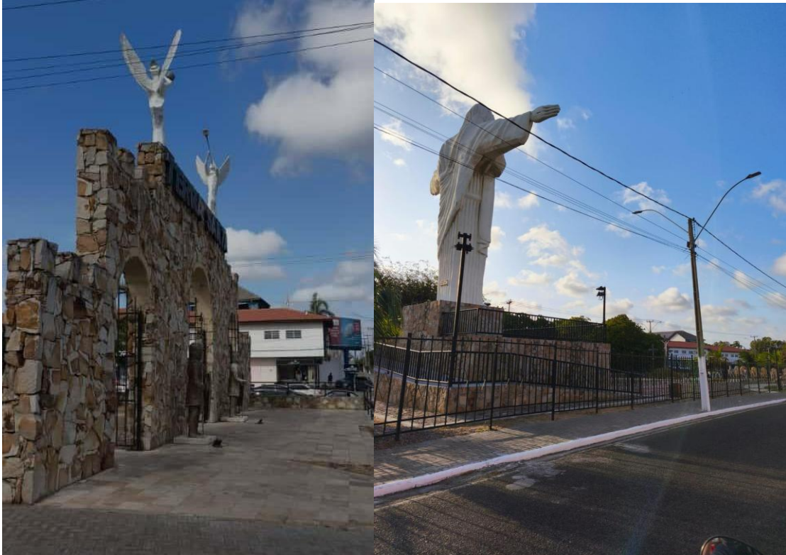
Terra Santa (Alexandra Gabriel, 2025).