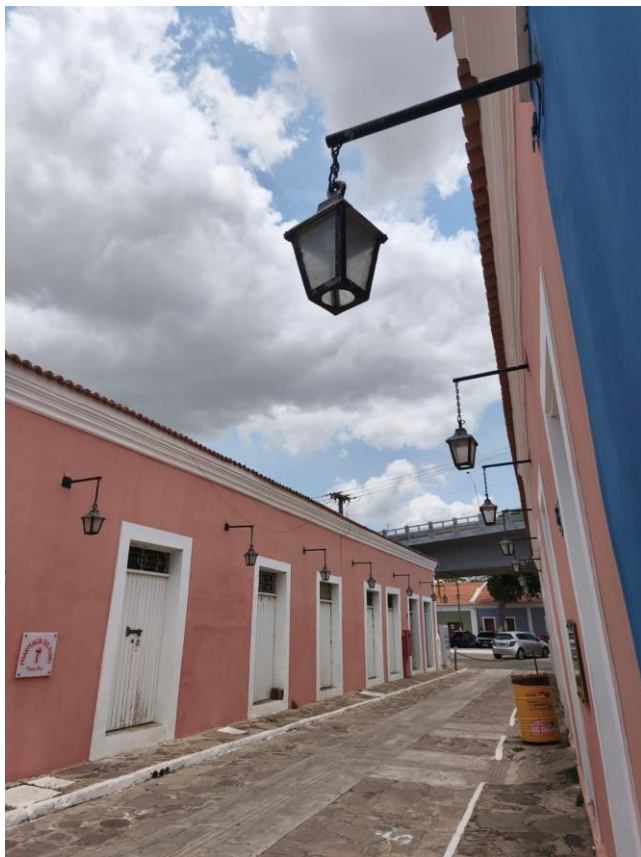
Porto das barcas (Alexandra Gabriel, 2025).