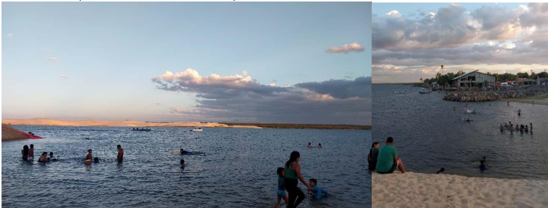
Lagoa do Portinho (Alexandra Gabriel, 2025).