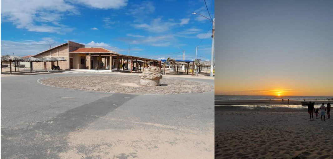
Praia da Pedra do Sal (Alexandra Gabriel, 2025).